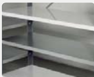
Hyller, komplett med 4 hyllekroker