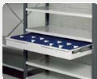
Uttrekkskuff – RAL 7035

Art. nr. 60 391-01 1000x300 mm Art. nr. 60 392-01 1000x400 mm Art. nr. 60 392-01 1000x500 mm Art. nr. 60 394-01 1000x600 mm