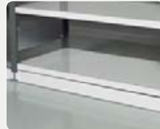
Sokkellist / hylleforkant – RAL 7035

Art. nr. 60 396-01 2100x300 mm Art. nr. 60 397-01 2500x300 mm