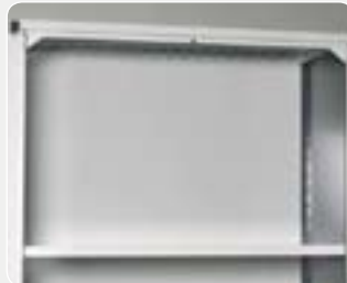
Rygg – RAL 7035

Art. nr. 60 396-01 2100x300 mm Art. nr. 60 397-01 2500x300 mm