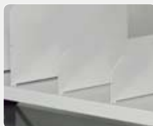
Deleplate – RAL 7035

Art. nr. 60 399-01 100x400x95 mm Art. nr. 60 400-01 100x500x95 mm